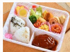
キッズプレート…1,050円