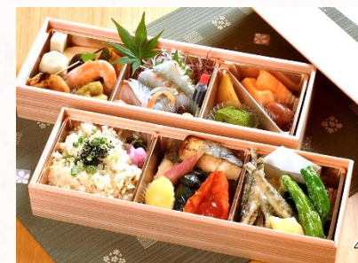
(箱寸法/18cm×30cm高さ約10cm 高さ約10cm)